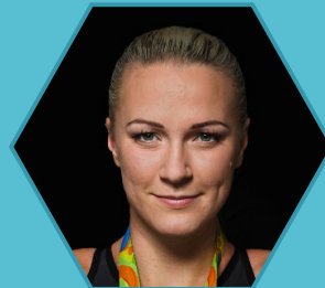
Sarah Sjöström OS-guldmedaljör och världsrekordhållare