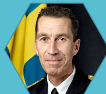
Micael Bydén Sveriges Överbefälhavare Försvarsmakten