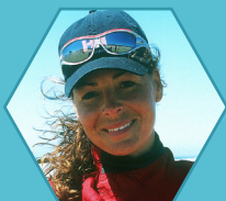
Reneta Chlumska Äventyrare, författare & talare