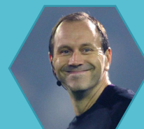
Jonas Eriksson Sveriges mest framgångsrika fotbollsdomare